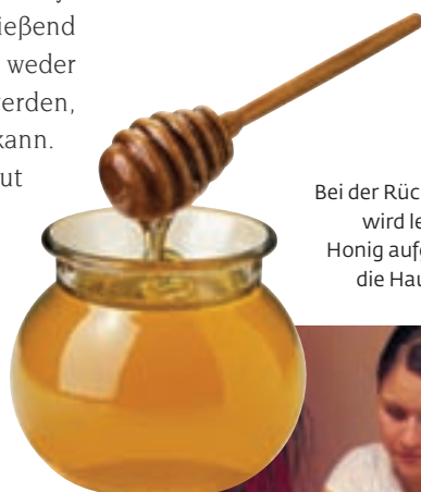
Bei der Rückenbehandlung wird leicht erwärmter Honig aufgetragen und in die Haut eingearbeitet

Zu Hause sollte die Kundin vor allem hochwertige Feuchtigkeits- und Nachtcremes sowie ein bis zwei Mal wöchentlich Feuchtigkeitspackungen einsetzen. Ist die Haut ausreichend hydriert und mit Fett versorgt, schuppt sie sich nicht so schnell ab, bleibt also länger braun. Auch die Augenpartie braucht meist sehr intensive Pflege. Hier helfen spezielle Augenampullen, -packungen und -cremes. ■