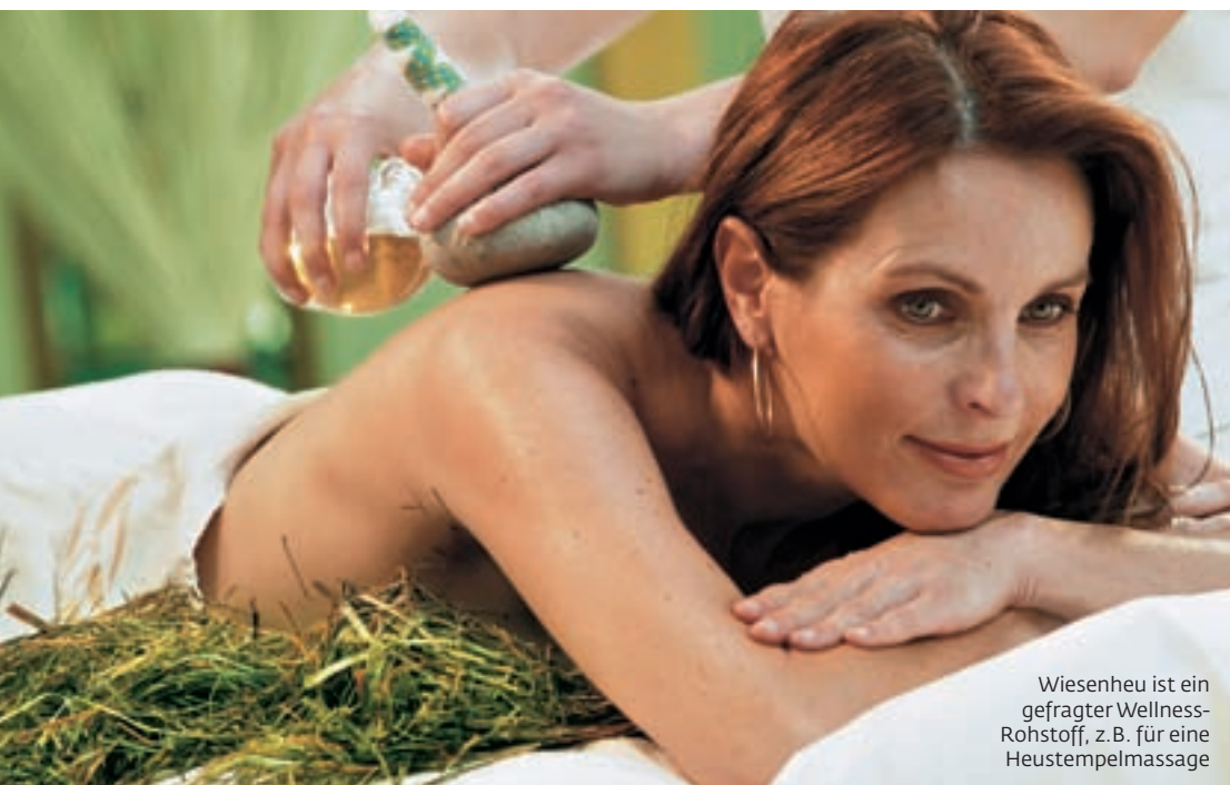
Wiesenheu ist ein gefragter Wellness-Rohstoff, z.B. für eine Heustempelmassage

Warum in die Ferne schweifen, wenn viele natürliche Beauty-Ressourcen doch so nah sind? Ob z.B. Kräuter oder Trauben: Aus regionalen Wirkstoffen lassen sich tolle Treatments zaubern!