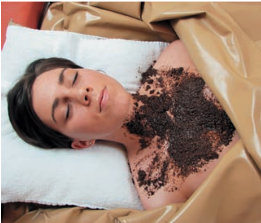
Anti-Aging mit Trauben: die Weintresterpackung