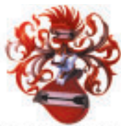
E. RITTER COSMETICS

„Die 25igste BEAUTY FORUM AUSTRIA in Salzburg 2010 war für uns ein toller Erfolg. Wir nahmen diese Tage zum Anlass, 15 Jahre Malu Wilz in Österreich zu feiern. Die Präsentationsmöglichkeiten der Neuheiten unserer Exklusivmarken sind in diesem Rahmen perfekt und wurden von vielen unserer Kunden und vielen Interessenten genutzt. Besonders wichtig finden wir, dass es sich um eine reine Fachmesse handelt.“